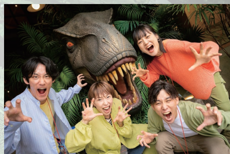
チームで協力してミッションをクリア!