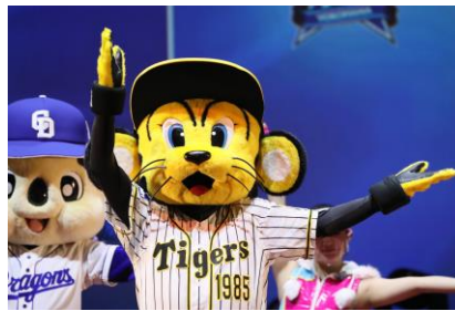
阪神タイガース トラッキー