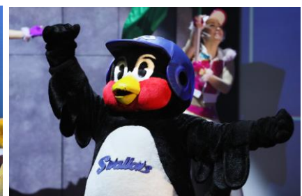
東京ヤクルトスワローズ つば九郎