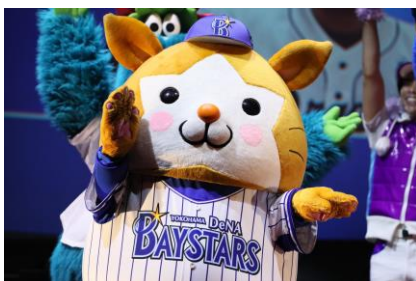
横浜DeNAベイスターズ DB. スターマン