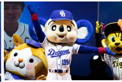
中日ドラゴンズ ドアラ