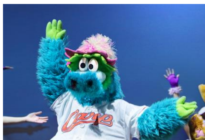
広島東洋カープ スライリー