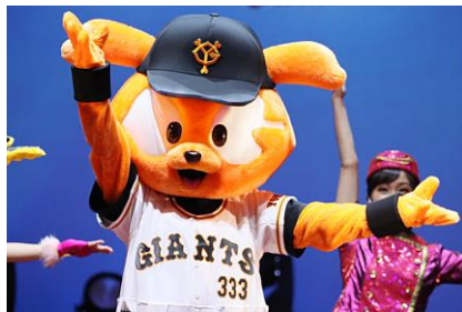
読売ジャイアンツ ジャビット